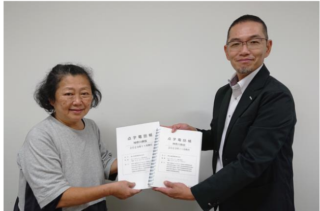
川崎市視覚障害者福祉協会